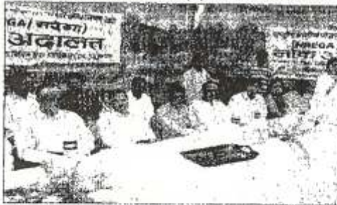
नरेगा लोक अदालत में उपस्थित न्यायिक अधिकारी व अन्य

लोक अदालत में न्यायिक अधिकारियों ने दी ग्रामीणों को नरेगा के प्रावधानों की जानकारी